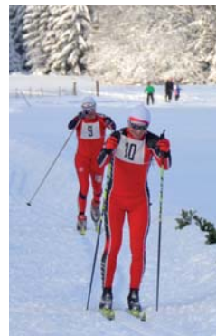
Neděle 17. ledna po celonočním sněžení a mrazu přinesla takřka pohádkové ráno s modrou oblohou a sluníčkem. Lyžařský oddíl Ski Nordic pod patronátem města Mariánské Lázně a obce Závěšín uspořádaly veřejný závod v běhu na lyžích volnou technikou pro rekreační i výkonnostní lyžaře „MARIÁNSKOLÁZEŇSKÝ SKATE“.