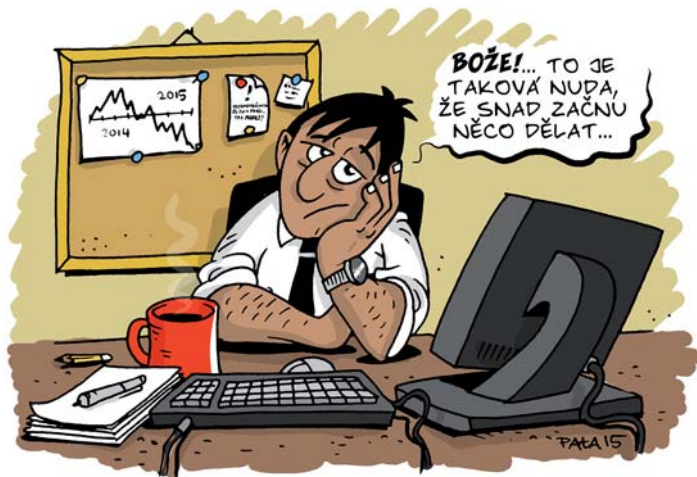
Baví vás Klub kreslířů a humoristů z časopisu Tapír, který najdete na www.kkh-tapir.cz . Autor dnešního vtipu je PATA.