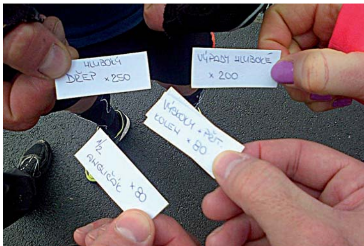
Trenérová převkapení aneb bonusová losovačka po standardním tréninku

KLUB ČESKÝCH TURISTŮ MARIÁNSKÉ LÁZNĚ za finanční podpory města Mariánské Lázně pořádá 6. února 2016 LYŽAŘSKÝ PŘEJEZD A TURISTICKÝ POCHOD (36. ročník)