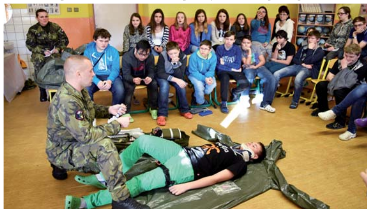
Ilustrační foto z loketské školy.

Příprava občanů k obraně státu je dlouhodobý projekt, který bude postupem času určen i pro střední školy a také širokou veřejnost, která se o tuto problematiku zajímá. POKOS je nedílnou součástí plánování obrany státu. Zákonná povinnost občanů bránit svou vlast nezanikla ani s profesionalizací naší armády. Systematickou a diferencovanou přípravou získají občané potřebné schopnosti, které jim umožní se na obraně státu aktivně podílet a za obranu České republiky nést i část spoluodpovědnosti.