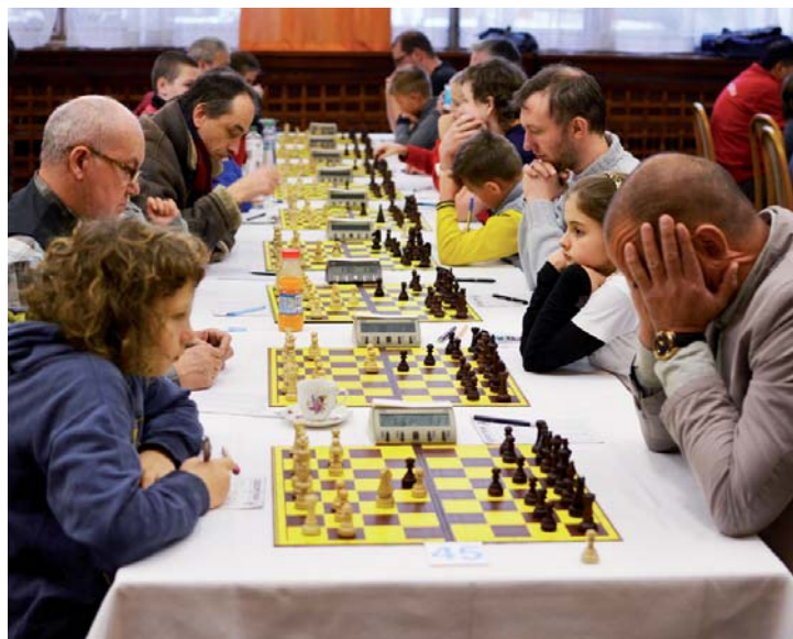
Nejtiší sportovní utkání napříč generacemi.

Za účasti zhruba 150 hráčů z 23 zemí světa (z nejvzdálenějších např. Austrálie, Jižní Korea, Irán, USA, Indie atd.) se turnaj vrací na půdu města, jehož historická tradice šachu sahá až k první republice. Když už jsme u historie, jistou zajímavostí je, že 1. ročníku v roce 2002 se zúčastnil též současný mistr světa Magnus Carlsen z Norska, kterému v tu dobu bylo 11 let a skončil na 10. příčce. Nejmladší hráčka letošního turnaje se narodila v roce 2008 a jedním z nejstarších účastníků je 82letý pán, čili věkový rozdíl mezi nejmladším a nejstarším hráčem turnaje je v podstatě 3/4 století. Nejpochybnější zastoupení mají, krom českých hráčů, šachisté z Polska, Ruska a Německa. Součástí festivalu jsou uzavřený velmistrovský turnaj, ve kterém lze splnit normu mezinárodního velmistra, dva uzavřené mistrovské turnaje, ve kterých lze splnit normu mezinárodního mistra a otevřený turnaj se zápočtem do světového žebříčku ELO FIDE. Pro milovníky rychlých hry je pořádán též turnaj v rapidu a bleskovém šachu. V listopadu 2016 se poprvé v historii v České republice, a to právě v Mariánských Lázních, uskuteční Mistrovství světa seniorů v šachu. Tento šampionát naváže na tradici významných šachových akcí, které se zde v minulosti konaly, prozradil Mariánskolázeňským novinám Dr. Jan Mazuch, ředitel turnaje a seriálu Czech Tour a MS seniorů 2016. (PP)