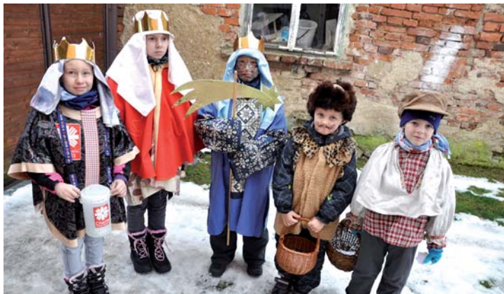
Malí koledníci ve Vlkočovicích.