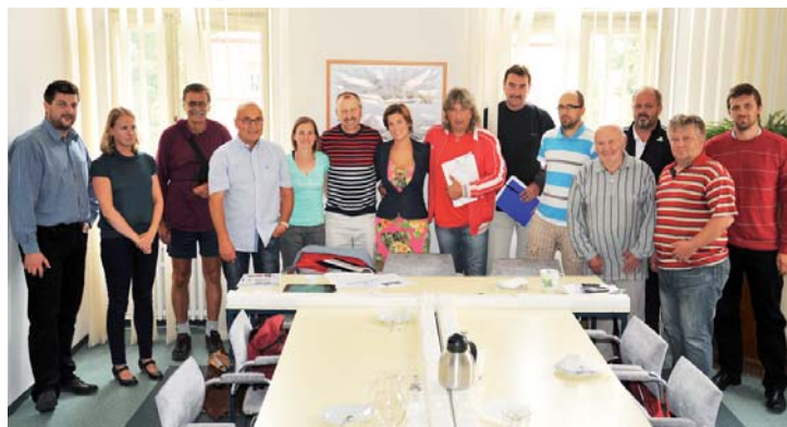
Komise sportu při svém zasedání.