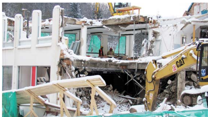
Budova Bati v pondělí 18. ledna 2016.

Předprodej vstupenek zajišťuje cestovní agentura Richter Tour – tel. 603 805 430